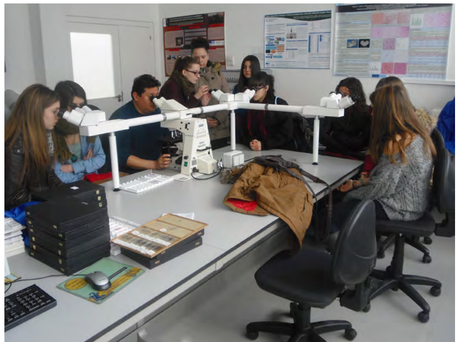
Alumnos participantes en los Circuitos científicos observando muestras de tejido encefálico al microscopio.

El laboratorio de EEB realiza análisis de muestras de vacuno que se ha sacrificado en los mataderos y que encontrarás en las carnicerías o supermercados. Todos los días reciben muestras del cerebro y las analizan